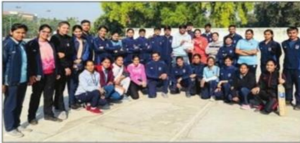
हिंसार में जीजेयू के एनसीसी कैडेट्स खेल प्रतियोगिता में हिस्सा लेने के बाद। संसार