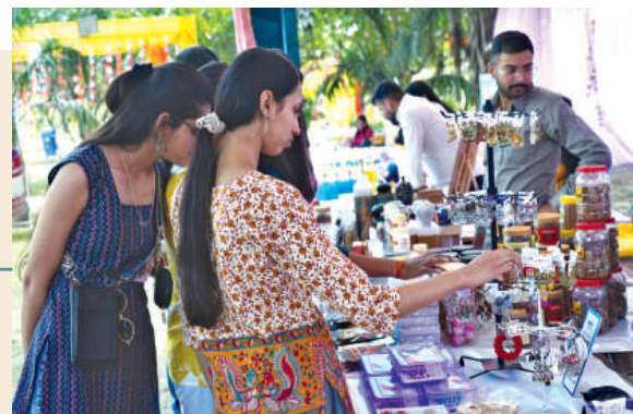
स्वदेशी हाट की एक झलक