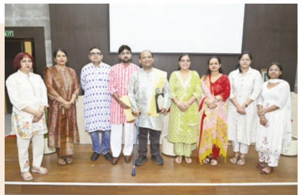
कहानी कार्यशाला- 'कहानी अभी बाकी है' सत्र के वक्ता