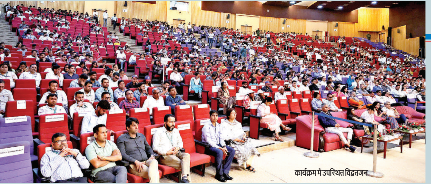
कार्यक्रम में उपस्थित विद्वतजन

समय में युवाओं के सामने सबसे बड़ी जिम्मेदारी है कि वे इस मूल विचार को समझें और अपने जीवन में उतारें। किसी भी राष्ट्र की शक्ति का आकलन उसकी सैन्य, आर्थिक, तकनीकी और सामाजिक शक्ति से किया जाता है। इसलिए युवाओं को इन चारों क्षेत्रों में से किसी एक क्षेत्र में योगदान देने का संकल्प लेना चाहिए। यह राष्ट्र निर्माण के लिए बेहद जरूरी है, इसलिए यह आवश्यक है कि युवा केवल नौकरी तक सीमित न रहें, बल्कि जीवन में एक बड़ा लक्ष्य निर्धारित करें। उन्हें यह तय करना होगा कि वे राष्ट्र निर्माण में किस प्रकार योगदान देंगे। 'स्व' का बोध इसी दिशा में पहला कदम है, जो व्यक्ति को अपने कर्तव्य और उद्देश्य के प्रति जागरूक बनाता है।