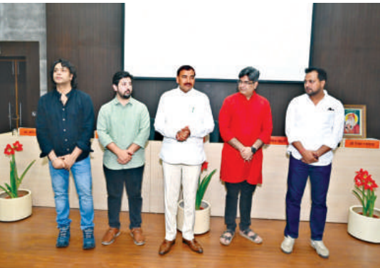
किताब लेखन कार्यशाला- 'आप लिखोगे, दुनिया पढ़ेगी' सत्र में भाग लेने वाले वक्ता।

'गुरु' शब्द का अर्थ है-अंधकार का निराकरण करने वाला। भारत को विश्व गुरु माना जाता है। ऐसे में विकसित भारत को आर्थिक रूप से सशक्त बनाना आवश्यक है। भारतीय मूल्यों के आधार पर ही भारत