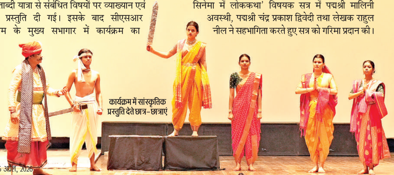
कार्यक्रम में सांस्कृतिक प्रस्तुति देते छात्र-छात्राएं